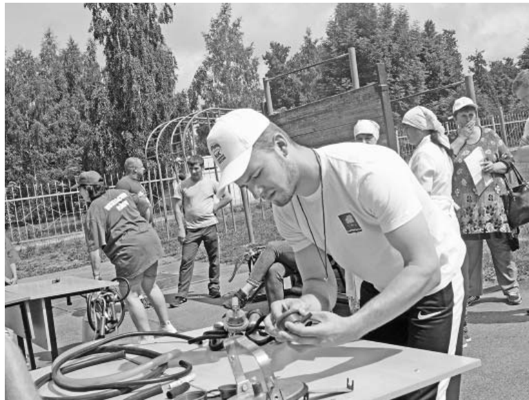
Соревнования косарей и дояров.

дого члена думиничской сборной за участие в областной «малой олимпиаде», за борьбу и самоотдачу, за волю к победе.