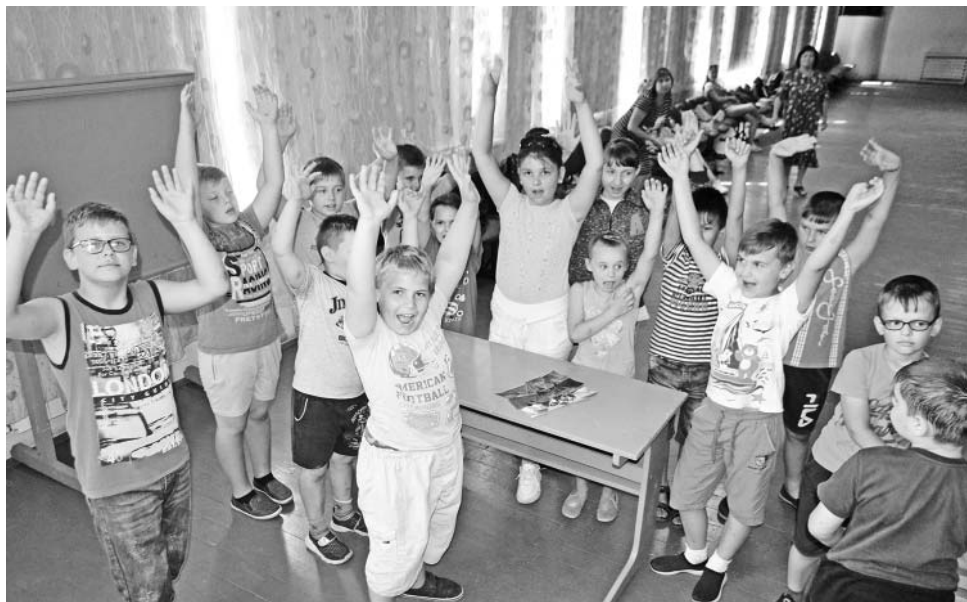
Игровая программа в районном Доме культуры.