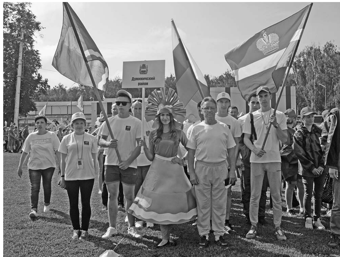
Сборная Думиничского района на торжественном открытии игр.

листы: парни сражались и в упорной борьбе заняли вторую строчку итоговой турнирной таблицы (108 очков), пропустив вперед лишь соперников из Дзержинского района. А вот с канатом в этом году не сложилось – мы вистую проиграли первый же поединок и выбыли из дальнейшей борьбы с 74 очками.