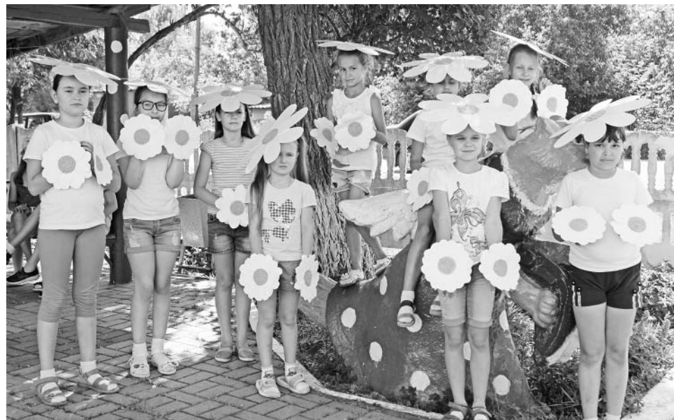
Праздник в Центре социальной помощи семье и детям.